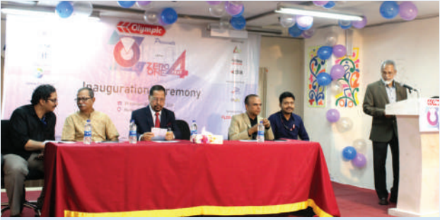
কম্পিউটার বিভাগের "জিরো ওয়ান ফেস্ট-৪"