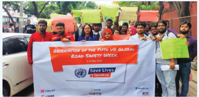
৫ম বিশ্ব নিরাপদ সড়ক সপ্তাহ, ২০১৯