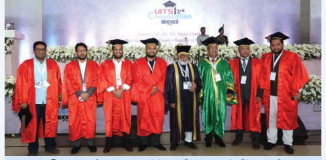
তৃতীয় সমাবর্তন, ২০১৮-এ ইউআইটিএস এবং ট্রাস্টি বোর্ডের সদস্যবৃন্দের সাথে সমাবর্তন বক্তা