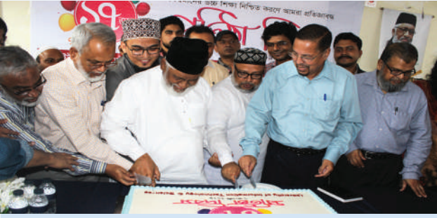
ইউআইটিএস-এর ১৭তম প্রতিষ্ঠা বার্ষিকী