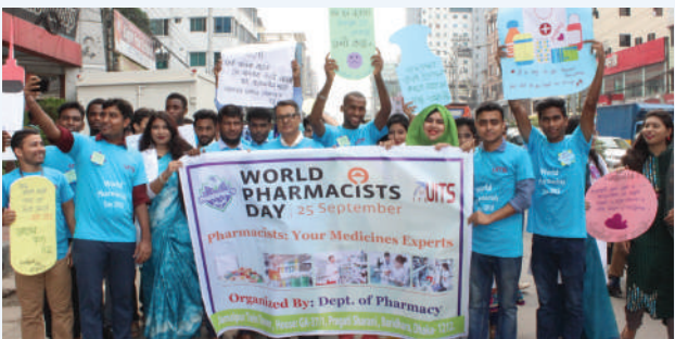
বিশ্ব ফার্মাসিস্ট দিবস, ২০১৯, ইউআইটিএস