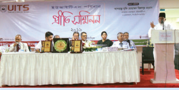
শ্রীতি সম্মিলন-২০১৯, ইউআইটিএস পরিবার