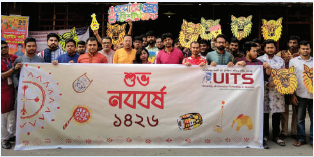
বাংলা ১৪২৬ উদযাপন উপলক্ষে শোভাযাত্রা