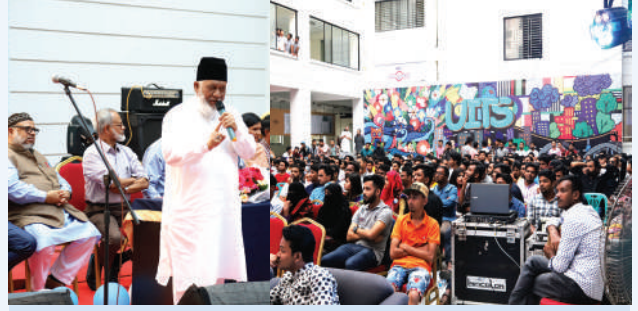
পুরকৌশল বিভাগের "সিডিল ফেস্ট-২০১৯"