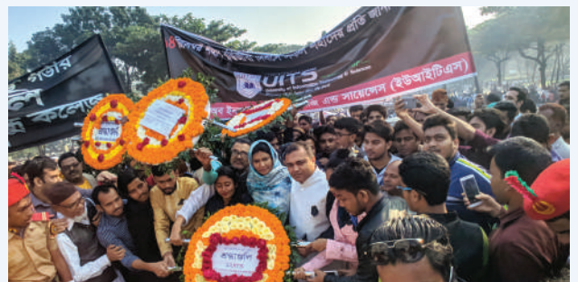
ইউআইটিএস-এর পঞ্চ থেকে বুদ্ধিজীবী দিবসে শ্রদ্ধাঞ্জলি