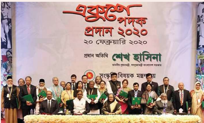
গণপ্রজাতন্ত্রী বাংলাদেশ সরকারের মাননীয় প্রধানমন্ত্রী শেখ হাসিনার সঙ্গে একুশে পদক বিজয়ীরা।

উল্লেখ্য, ২০ ফেব্রুয়ারি, ২০২০, রাজধানীর ওসমানী স্মৃতি মিলনায়তনে আনুষ্ঠানিকভাবে বাংলাদেশ সরকারের মাননীয় প্রধানমন্ত্রী শেখ হাসিনার হাত থেকে চেয়ারম্যান মহোদয় এ সম্মাননা পদকটি গ্রহণ করেন।