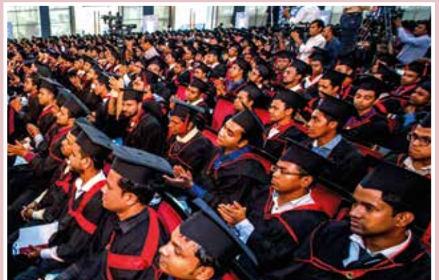
সমাবর্তন ২০১৮ সমাবর্তন অনুষ্ঠানে উপস্থিত গ্রাজুয়েটবৃন্দ।

“Apart from imparting professional skills among the youth of Bangladesh, UITS is providing value based education for developing human values and ethical practices which is vital for long term growth of the nation.”