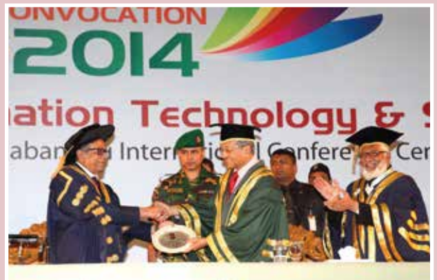
সমাবর্তন ২০১৪ গণপ্রজাতন্ত্রী বাংলাদেশের মহামান্য রাষ্ট্রপতি সমাবর্তন বক্তার হাতে সম্মাননা ক্রেস্ট তুলে দিচ্ছেন।