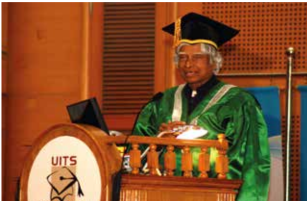
সমাবর্তন ২০০৯ সমাবর্তন বক্তা ভারতের সাবেক রাষ্ট্রপতি এ পি জে আব্দুল কালাম।