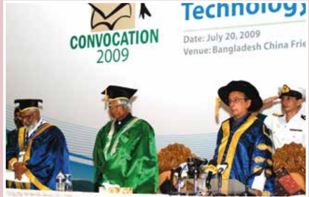
সমাবর্তন ২০০৯ গণপ্রজাতন্ত্রী বাংলাদেশের মহামান্য রাষ্ট্রপতি মো. জিল্লুর রহমানের সাথে সম্মানিত অতিথিবৃন্দ।